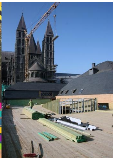
Le chantier du nouvel office de tourisme de Tournai