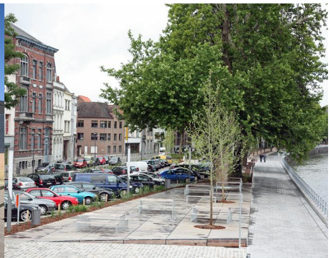
La promenade réaménagée du quai des Salines