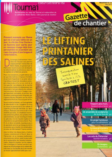
Couverture de la gazette de chantier n°6

Impact sur la ville : ce plan pour le quartier cathédral doit s'envisager comme le point de départ d'un processus englobant progressivement tout le centre-ville et basé sur l'intégration de la restauration du monument dans une dynamique d'amélioration du cadre bâti et du cadre de vie. Il se veut redonner au monument une présence et une modernité nouvelle.