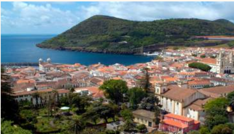
ANGRA DO HEROISMO, PORTUGAL

PRIX JEAN-PAUL-L’ALLIER POUR LE PATRIMOINE